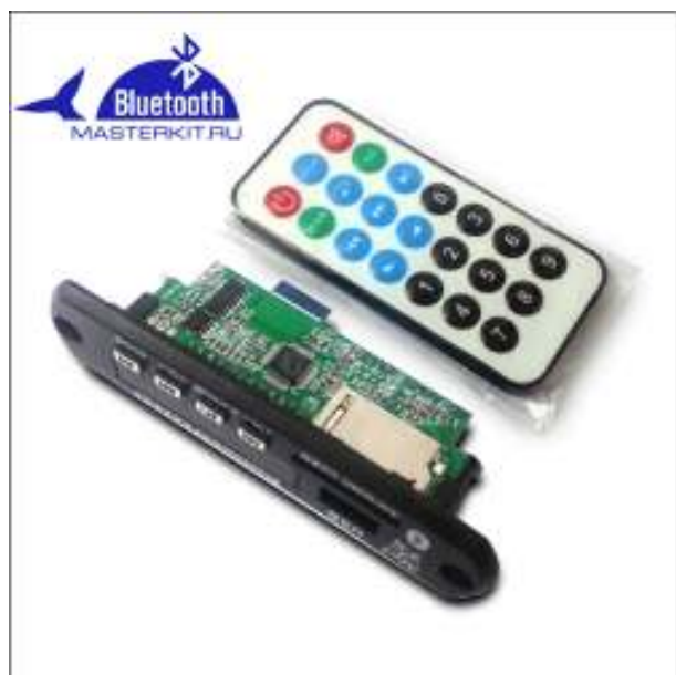
Рис.1. Внешний вид модуля